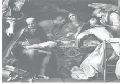
১৭শ শতকের একটি বিখ্যাত অঙ্কন।

লুক ১ঃ১-৪ অংশে চারটি সুসমাচার কোথা থেকে এসেছে।