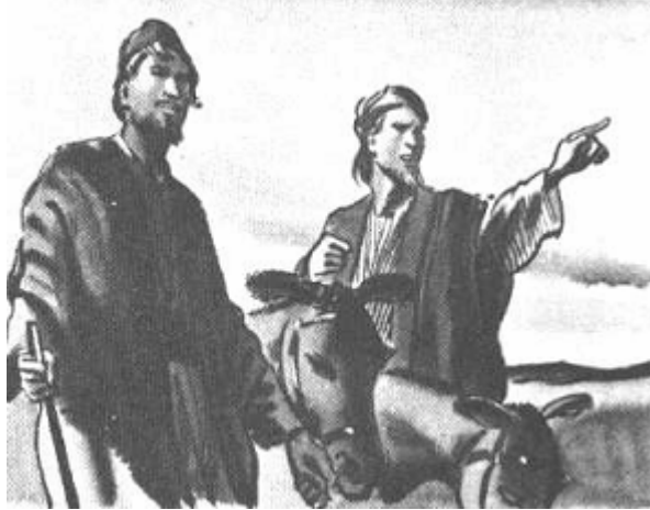
సాధారణంగా అపొస్తలులు జతగా గాని ఒక జట్టుగా గాని ప్రయాణించేవారు.

బర్నబా జట్టులో సభ్యులుగా ఉండడానికి అంతియొకయ సంఘం పంపించిన ఇద్దరు వ్యక్తులెవరో అ||కా|| 13:2-5లో చూడండి.