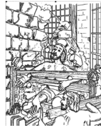
Paul et Silas en prison

Faites à un enfant plus âgé ou un enseignant lire ou raconter par mémoire le récit du geôlier de Philippes à partir d' Actes 16 : 22 à 36 . Ce texte décrit comment une famille a adoré Dieu chez elle.