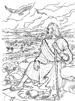
Moïse attend que les chercheurs reviennent lui informer sur la terre promise

moisson la recherche sur les gens, nous devons nous renseigner sur trois genres d'information :