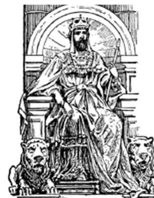
Le Roi Ezéchias assis sur son trône

Ce récit raconte comment un roi a envoyé des enseignants à son peuple, de sorte que son peuple se soit renouvelé.