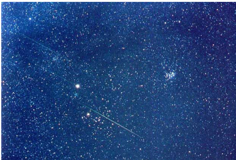
Les étoiles telles qu'Abraham les a vues.

Faites à quatre enfants plus âgés aller trouver des objets qui illustrent la foi. Si c'est trop difficile, alors dessinez de simples images de ces quatre choses :