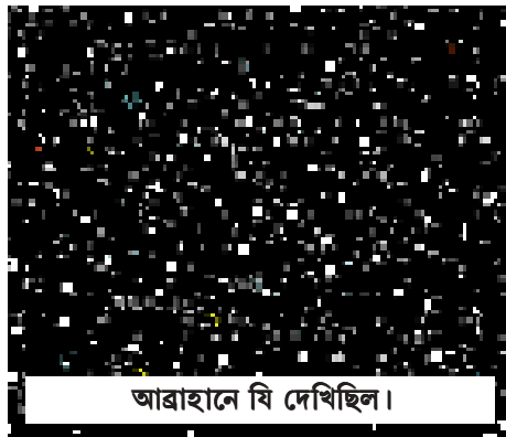
আব্রাহামে যি দেখিছিল।