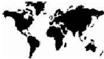
জগতের সমুদয় জাতি