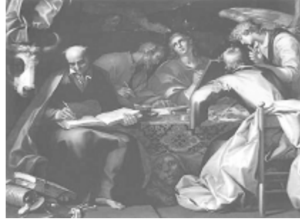
17 व्या शतकातील प्रसिद्ध चित्र

पाहा लूक 1:1-4 मध्ये शुभवर्तमाने कोठून आली.