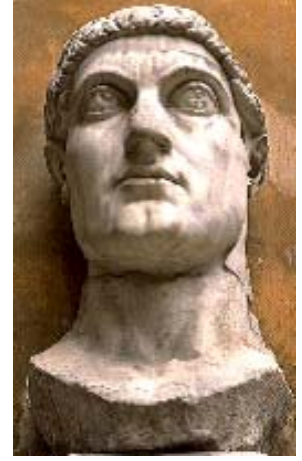
Statue of Constantine