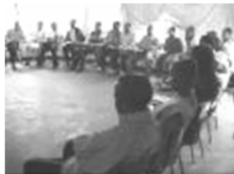
Assis en demi-cercle